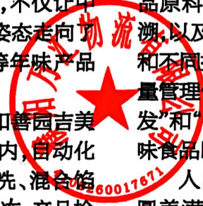
图 3.2-2 (1) 2025 年 1 月 9 日国际商报公示截图

口,南京相关企业开案流程到“规范对企业品原料的来溯,以及不同技贸量管理体系发”和“提前味食品以最人间烟火圆美满的自“角色”。扬鲜细腻的口一年一度海“荸荠甜一派繁忙景生产车间里个白胖可人师傅们手托托盘里,等