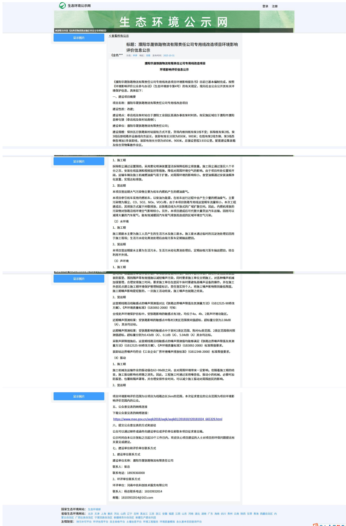
图 3-1 征求意见稿公示截图