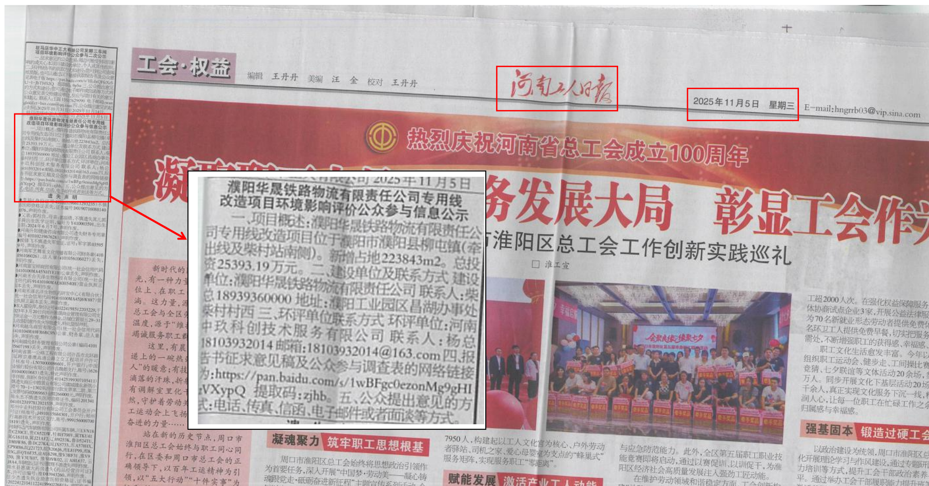
图 3-3 征求意见稿阶段报纸公示截图（2025 年 11 月 05 日）