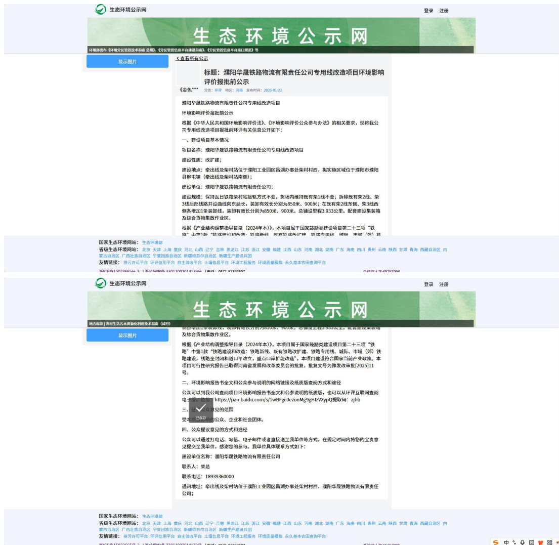
图 6-1 报批前网络公示截图