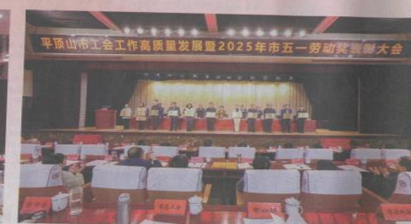
一、劳动竞赛表彰大会