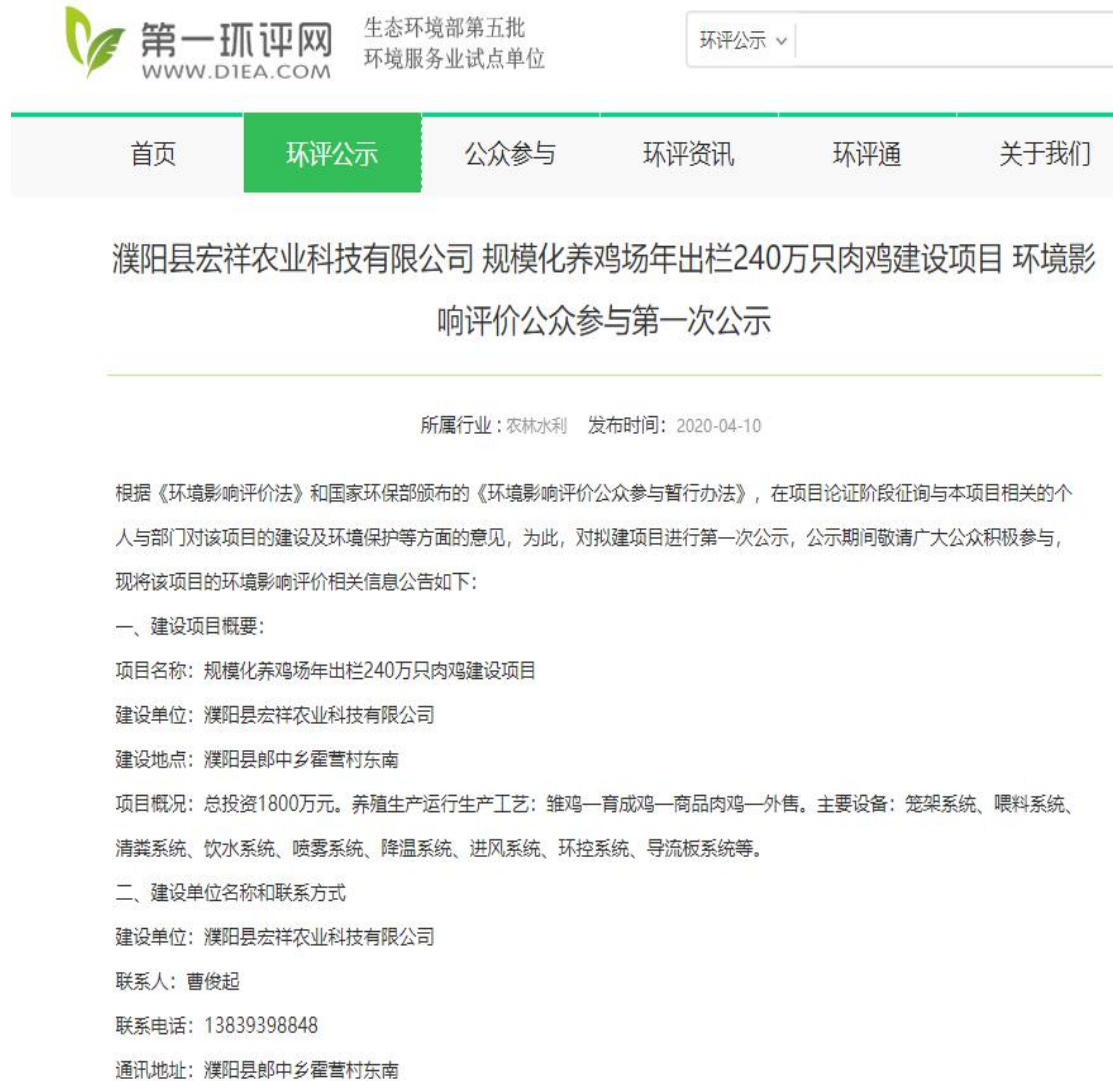
图 2-1 项目首次网络公示截图

我单位通过第一环评网网站公开了本项目环评信息，具体网络链接为 http://www.dlea.com/ ，符合《环境影响评价公众参与法》（生态环境部令第4号）中相关要求。一次公示截图见图 2-1。