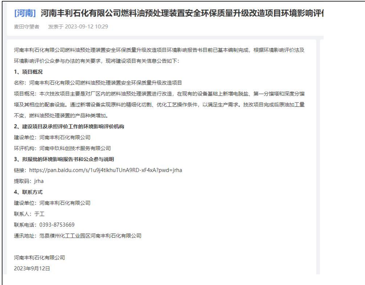
图 6.2-1 报批前网络公示截屏

本项目报批前公示平台采用全国建设项目环境信息公示平台网站，网址为（ https://www.eiacloud.com/gs/detail/1?id=30912jNXuV ）。本次公示时间为2023年9月12日，网络公示截图见图 6.2-1。