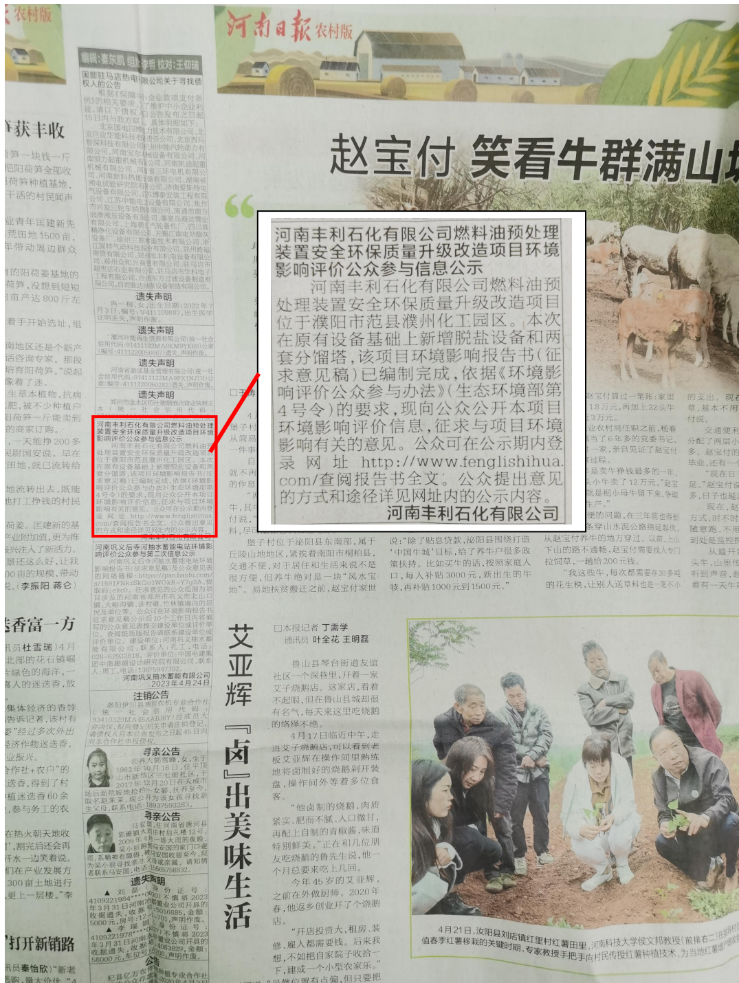
图 3.2-2 河南日报2023年4月25日公示刊登照片