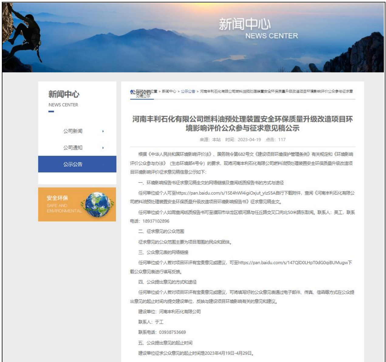
图 3.2-1 环境影响报告书征求意见稿公示截屏