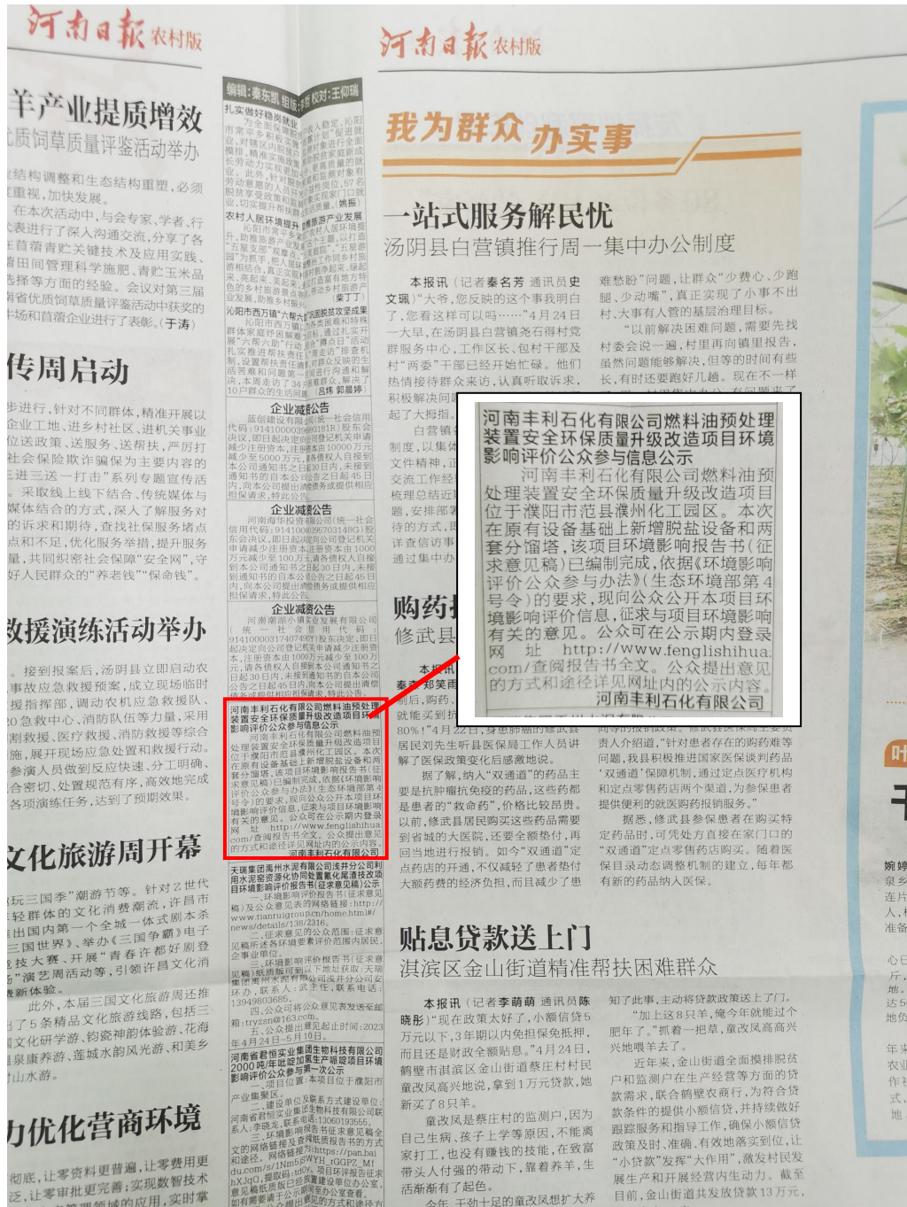
图 3.2-3 河南日报 2023 年 4 月 27 日公示刊登照片