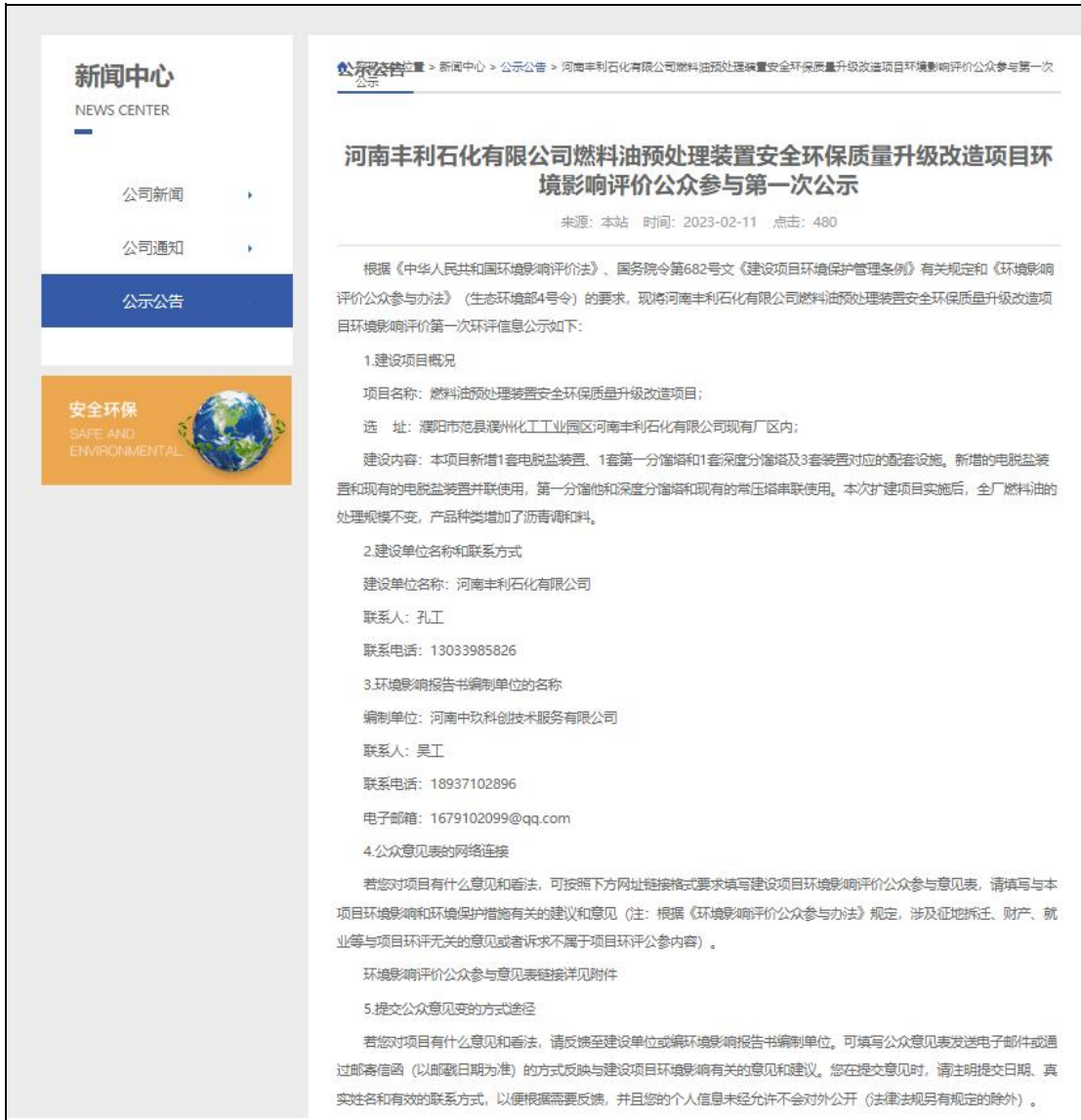
图 2.2-1 首次环境影响评价信息公开截屏